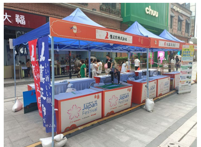
設営例：鷹正宗様ブース（JF 武漢会場）

【詳細内容】ブースサイズ：1ブースあたり3m×3m（9平米）/床面：パンチカーペット/受付デスク1台/イス2脚/ゴミ箱1個/照明（アーム型2個）/電源/看板（出展名、会社名など表示）/上記以外のものは別途有料でレンタル